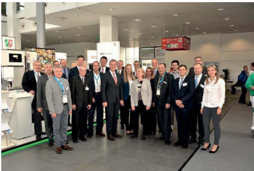
NRW Gemeinschaftsstand auf der IFAT 2016

Auszeichnung der TOP 10. Platzierung bei den GreenTec Awards 2017