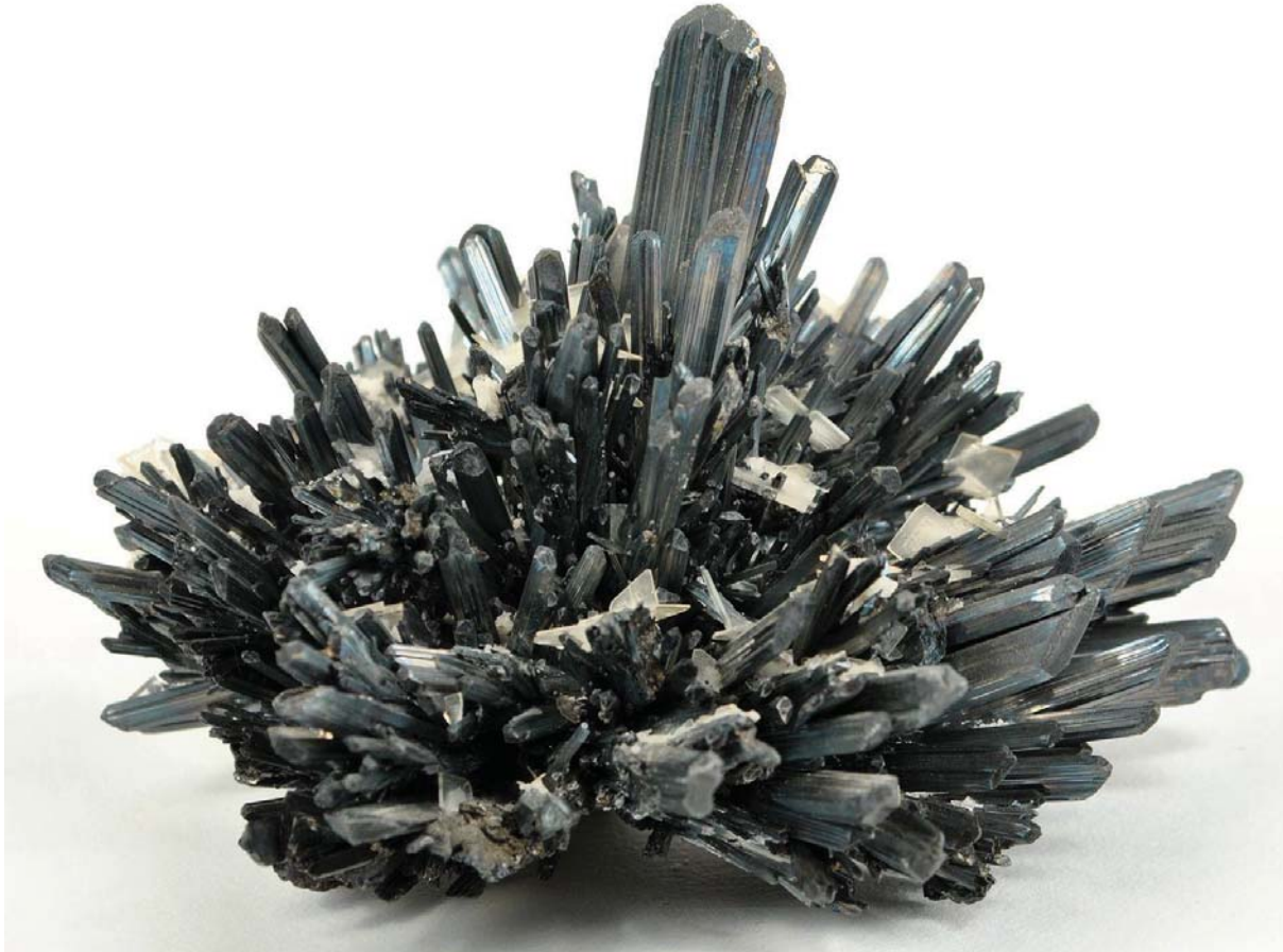
Abbildung 1: Das Mineral Grauspießglanz (Stibnit, Antimonit), das „Antimonium“ der Alten.

strahlenförmiger Kristalle vorkommt, erinnert tatsächlich an eine Blüte, vielleicht an die einer Chrysantheme.