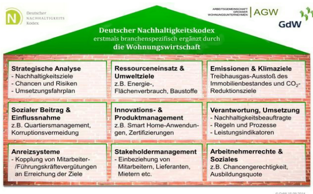
Abbildung 1: Nachhaltigkeit in der Wohnungswirtschaft 6

nehmen des GdW ein Instrument zu entwickeln, mit dem diese ihre Nachhaltigkeitsstrategie vereinfacht darstellen können.