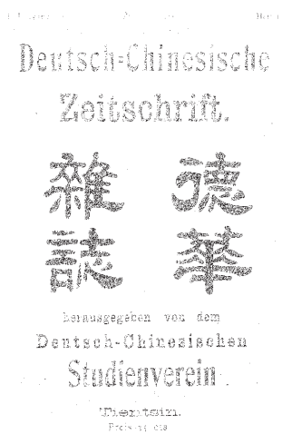
Abbildung 1 Zwei deutschsprachige Zeitschriften