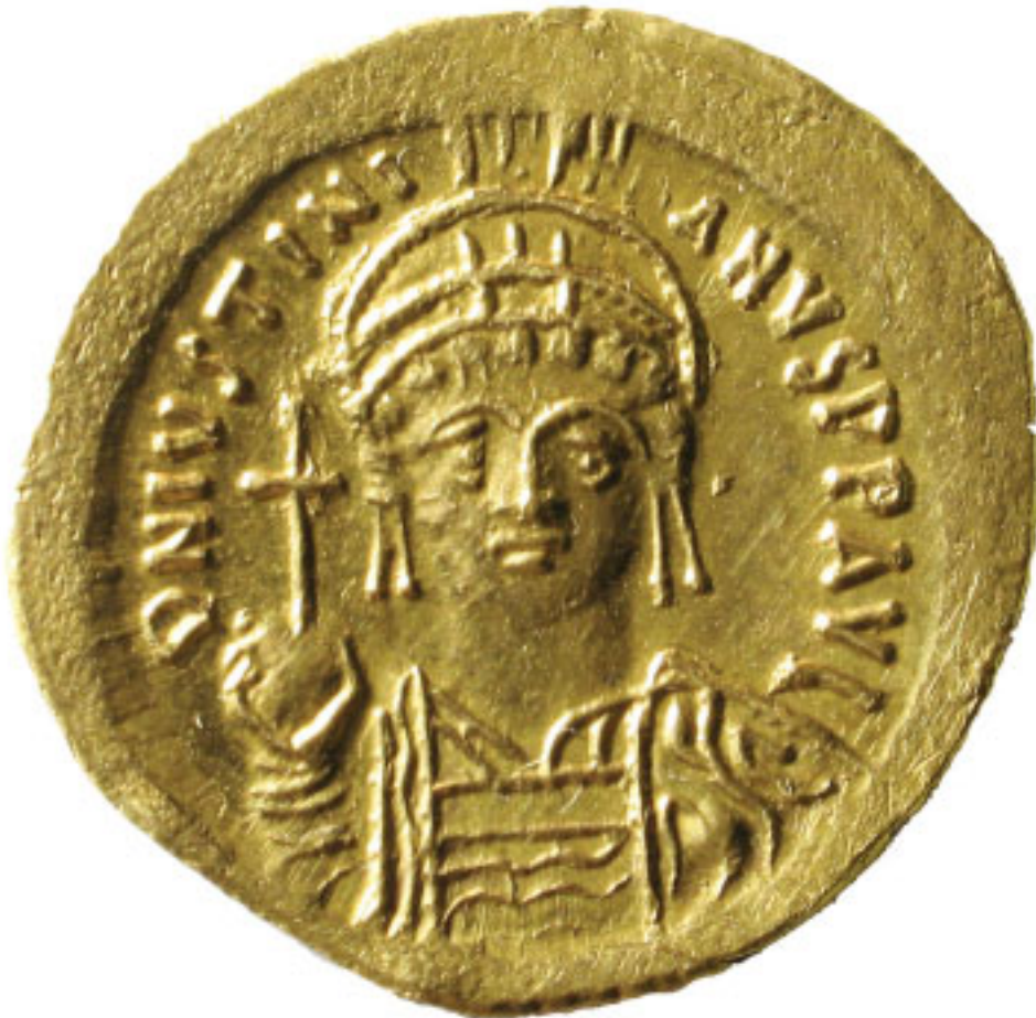
Ein goldener Solidus des Kaiser Justi- nian.

den 70er Jahren des 6. Jh. v. Chr. Eben hier auf der Taman-Halbinsel haben die Teer in den 540er Jahren v. Chr. Phanagoreia gegründet. Die fruchtbaren Böden der Taman-Halbinsel eigneten sich hervorragend zum Kornanbau. Im 4. Jh. v. Chr. wurde das Korn von dort, wie Demosthenes und andere antike Autoren berichten, sogar nach Athen exportiert. Neben den ergiebigen Ackerflächen gab es große Fischvorkommen, darunter auch Stör, Wildvögel und andere Tiere sowie Süßwasserquellen.