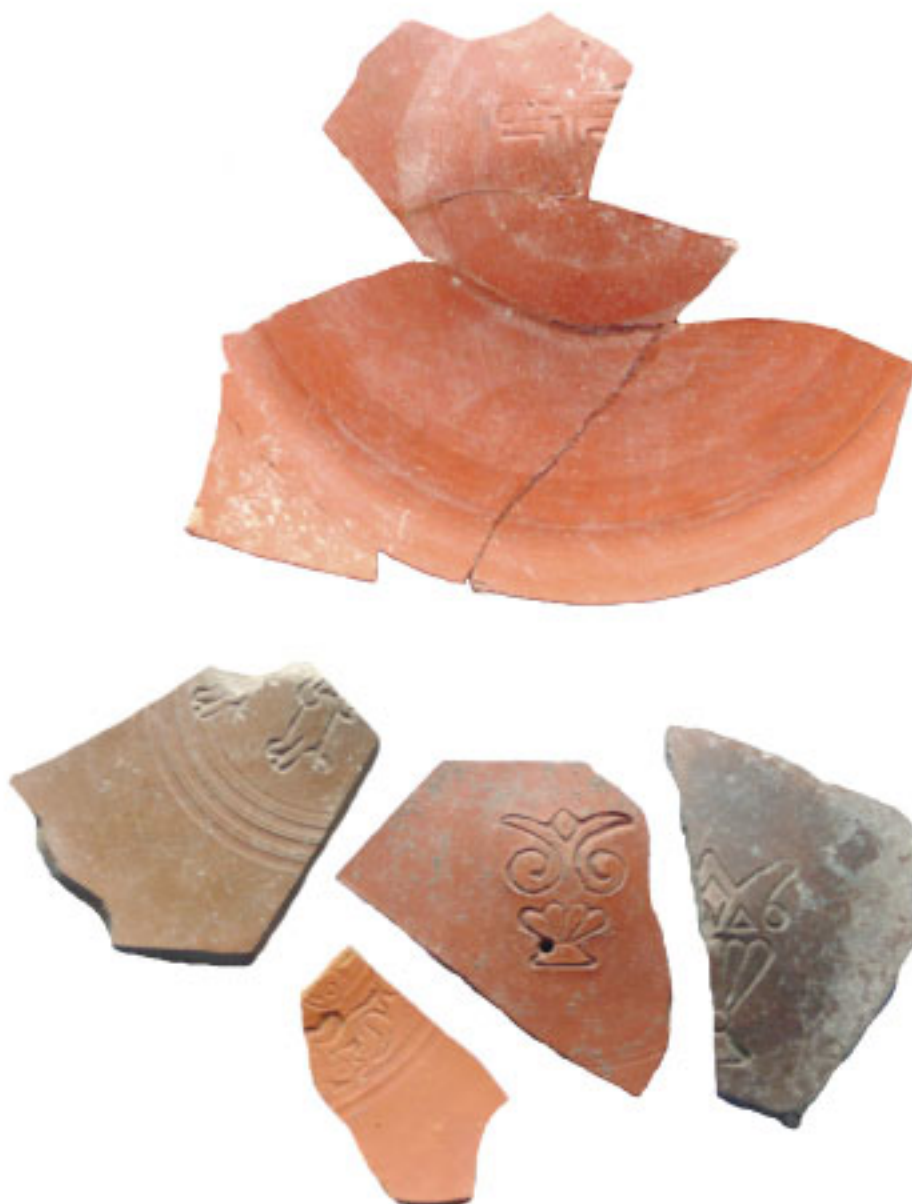
Teller mit christlichen Symbolen. Die christliche Gemeinde entstand in Phanagoreia lange vor der Christianisierung Russlands.

mit Holzöl eingerieben und in den Schatten gehängt werden, sind sie etliche Jahre zu bewahren, wobei ihr Wert noch mehr steigt... Dieses Land ist übrigens sehr fruchtbar und wartet darauf kultiviert zu werden; Wildvögel sind reichlich vorhanden, obwohl die früher oft zu findenden Fasane jetzt rar geworden sind; Fisch gibt es aber im Überfluss. Für Weidewirtschaft lassen sich, bei ver-