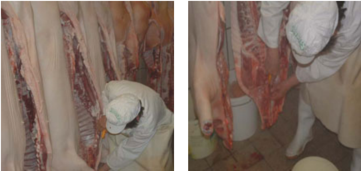
Abb. 2-3: Amtliche Tierärztin bei der Fleischbeschau

Die weitere Verarbeitung der Tierkörper erfolgt entsprechend den jeweiligen betrieblichen Anforderungen. Bei der industriellen Fleischgewinnung kann dies die Zerlegung in einem weiteren Betrieb sein, wobei entsprechende kühllogistische Notwendigkeiten zu erfüllen und Transporte zu bewältigen sind (s. Kap. 3.4.1). In handwerklich strukturierten Fleischereien findet in der Regel alles unter einem Dach statt, so dass bis zum POS keine weiteren Transporte anfallen [WEBER 2003].