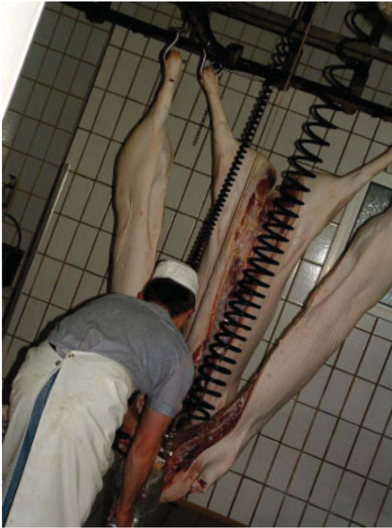
Abb. 2-2: Spaltung eines Schweines an der Wirbelsäule mittels Elektrosäge

Die nun folgende Fleischuntersuchung durch den amtlichen Fleischbeschauer klärt die Genusstauglichkeit des gewonnenen Fleisches. Die amtliche Untersuchung der Schlachtkörper und zugehöriger Nebenprodukte hat unverzüglich nach der Schlachtung zu erfolgen. Besonderes Augenmerk gilt dabei Zoonosen und Krankheiten, die in Liste A und ggf. B des Internationalen Tierseuchenamtes (OIE) aufgeführt sind. Zum Abschluss bringt der amtliche Tierarzt ein Genusstauglichkeitskennzeichen - Farb- oder Brandstempel - auf definierte Teile des Tierkörpers auf [EUROPA 2004b].