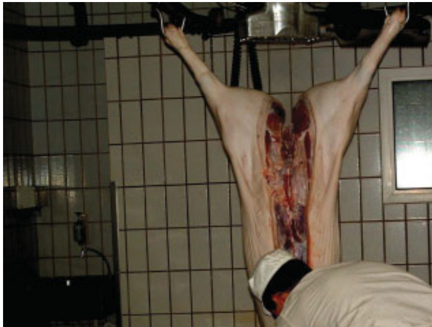
Abb. 2-1: Ausnehmen eines Schweines bei der Schlachtung

Das Ausnehmen der Schlachttiere ist der nächste Arbeitsgang. Dabei dürfen Magen und Darm nicht verletzt werden. Das Entleeren und Reinigen von Magen und Darm darf unter keinen Umständen zeitgleich mit anderen Arbeiten im Schlachtraum geschehen. Eine zeitliche oder räumliche Trennung ist zwingend erforderlich. Die Abfälle werden sofort in Konfiskatbehälter verbracht [EUROPA 2004 a; LUTZ 2006].