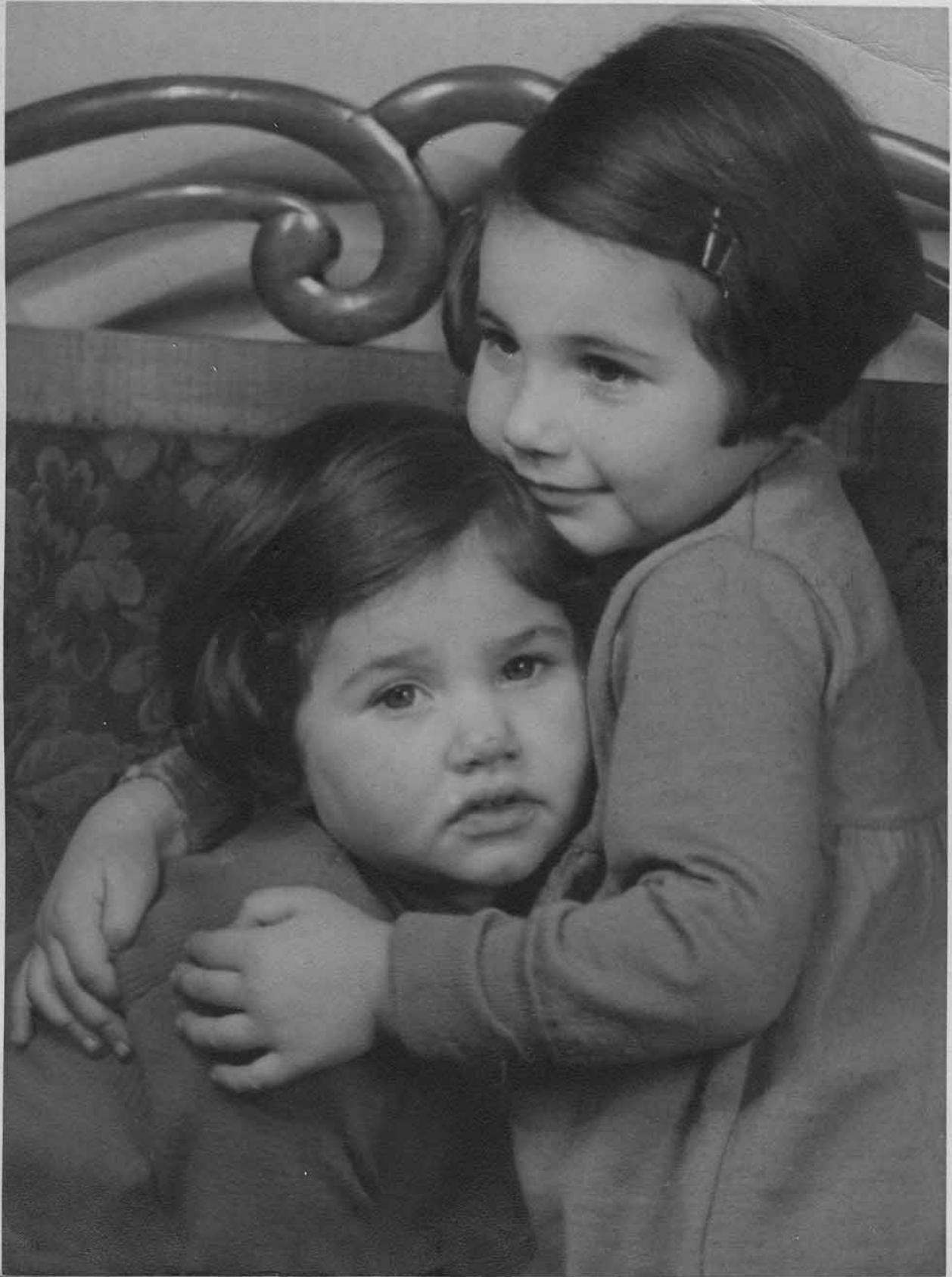
1938 , Würzburg Die kleine Schwester muss getröstet werden