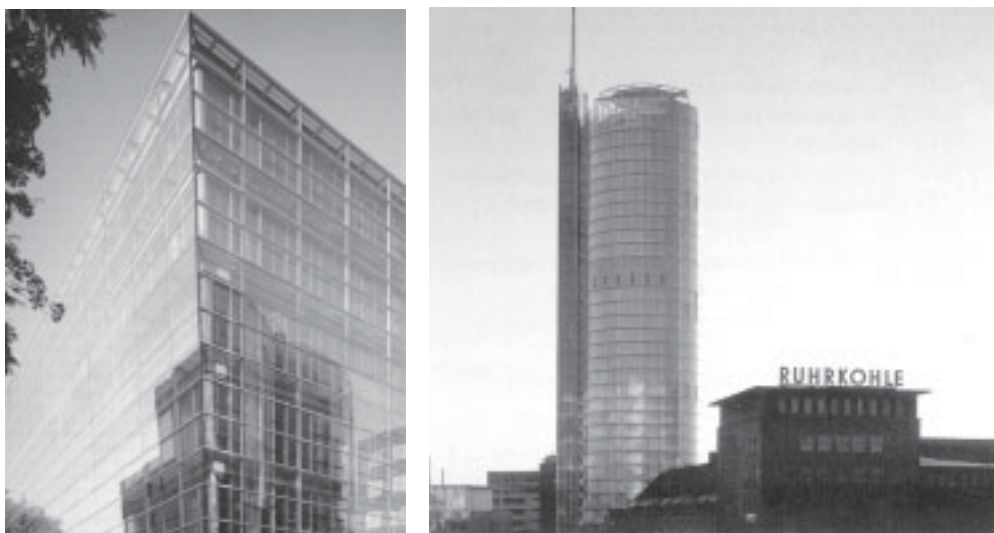
Abbildung 1.1: Beispiele realisierter Projekte

Die Gebäudehülle besitzt aufgrund ihres gestalterischen Elements einen außerordentlich prägenden Charakter für das Erscheinungsbild und den Gesamteindruck eines Bauwerks. Die Fassade als äußere Schutzhaut transportiert dabei allerdings nicht nur architektonisch begründete Leitmotive, sondern hat auch zahlreiche weitere Funktionen, insbesondere im Hinblick auf ein bauphysikalisches Anforderungsprofil, zu erfüllen. Seit Ende des 20. Jahrhunderts findet bei zahlreichen Entwürfen und Konzeptionen von modernen Bürogebäuden und innerstädtischen Hochhäusern der Typ der Glas-Doppelfassade eine weitverbreitete Anwendung. So konnten in der Vergangenheit einige Gebäude, die diesen Fassadentyp in ihrer Planung berücksichtigten, realisiert werden, und auch in dem weiten Spektrum der Gebäudesanierung fand diese Fassadenart als eine sinnvolle ergänzende Maßnahme ihre Verwendung.