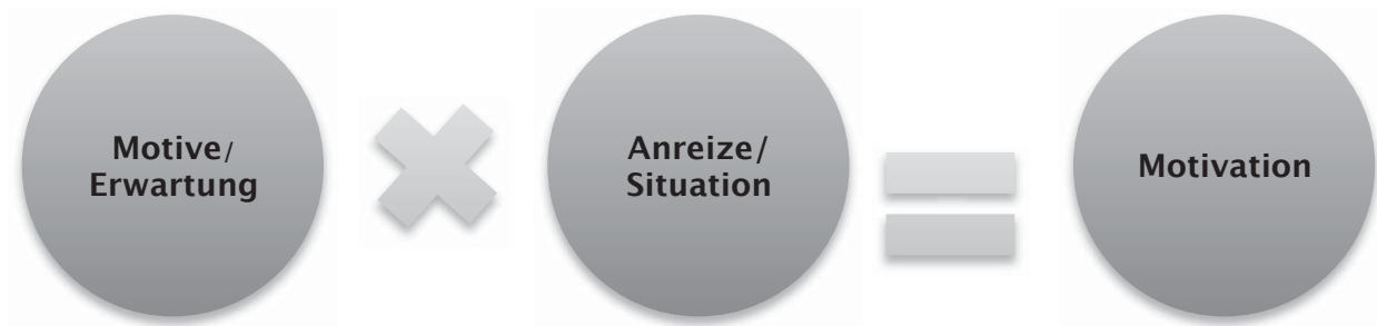
Abbildung 2: Motivation als ein Produkt aus Motiv und Anreiz (Heckhausen, 1989)

Motivation kann als ein Produkt aus individuellen Merkmalen von Menschen, plus ihren Motiven und den Merkmalen einer aktuell wirksamen Situation, in der Anreize auf die Motivation einwirken und diese aktivieren, bezeichnet werden (Heckhausen, 1989). Der “Faktor Motive” wird als die Bedürfnisse, Interessen und Erwartungen einer Person bezeichnet, während der zweite Faktor die “Situation”, der für die “Motivation” ausschlaggebend ist, sich mit “Anreizen und Anforderungen” an die Organisation definieren lässt (Sturm et al., 2011).