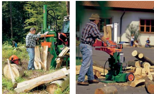
Abbildung 3: Beispiele für Vertikalspalter

Horizontal- bzw. Waagrecht- und Vertikal-, bzw. Senkrechtspalter sind relativ einfach konstruierte Maschinen, mit denen Rundholz lediglich in Längsrichtung zerteilt bzw. gespalten, nicht jedoch auf gewünschte Längen eingekürzt werden kann. Darüber hinaus wird jeder einzelne Spaltprozess durch den Bediener ausgelöst. Abbildung 3 zeigt Beispiele für Vertikalspalter.