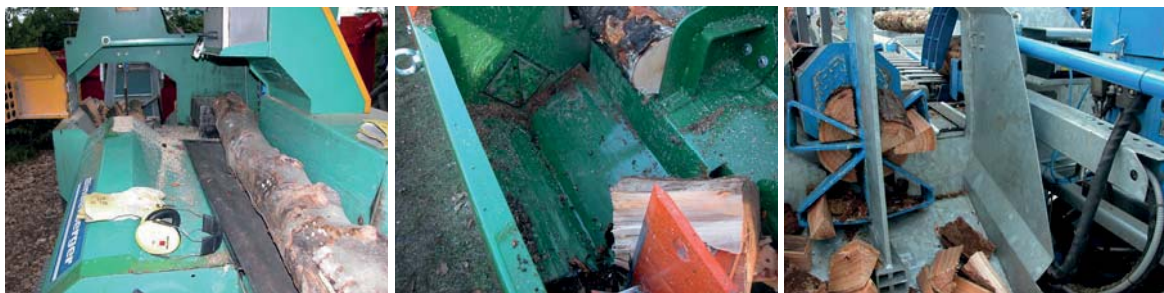
Abbildung 6: Beispielhafte Darstellung von Produktionsstationen von Schneid-Spalt-Prozessoren

Manuell durch den Maschinenführer oder hydraulisch unterstützt, wird der zu verarbeitende Stamm auf ein Einzugsförderband gebracht, das diesen in Richtung der Spalteinheit transportiert. Am Ende befindet sich ein Anschlag, durch dessen Verstellung in horizontaler Richtung die Scheitlänge variiert werden kann, da damit die Distanz zwischen Anschlag und einer quer zur Stammrichtung arbeitenden Schneidgarnitur einer Sägeketteneinheit oder einem Kreissägeblatt variiert wird. Ein Holzniederhalter fixiert den Stamm und die Schneidgarnitur bzw. das Kreissägeblatt trennt ein Stammstück in der gewünschten Länge ab. Dieses fällt seitlich in einen Spaltkanal und wird mittel eines hydraulisch betriebenen Druckstempels (vergleichbar dem der oben beschriebenen Horizontalspalter) durch ein feststehendes Spaltkreuz gedrückt. Durch Variation des Spaltkreuzes kann die Anzahl und damit die Größe der aus den Stammstücken gewonnenen Scheite bestimmt werden. Hinter dem Spaltkreuz fallen die Scheite dann auf das Förderband zum Verpackungs-, Lager- oder Transportbehälter. Abbildung 6 zeigt beispielhaft ein Einzugsförderband mit Anschlag, den Spaltkanal mit Druckstempel und ein 8-fach Spaltkreuz.