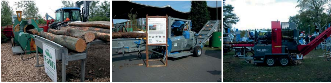
Abbildung 5: Verschiedene Modelle von Schneid-Spalt-Prozessoren

Üblicherweise wird dem Säge-Spalt-Prozessor ein Auflagetisch für die zu verarbeitenden Stämme spendiert. Er dient als Puffer, um eine durchgängige Scheitholzproduktion sicherstellen zu können, und wird mittels eines Krans mit Stämmen beschickt. Der Kran ist dabei in der Regel nicht direkt am Säge-Spalt-Prozessor, sondern meist an einem separaten Fahrzeug montiert.