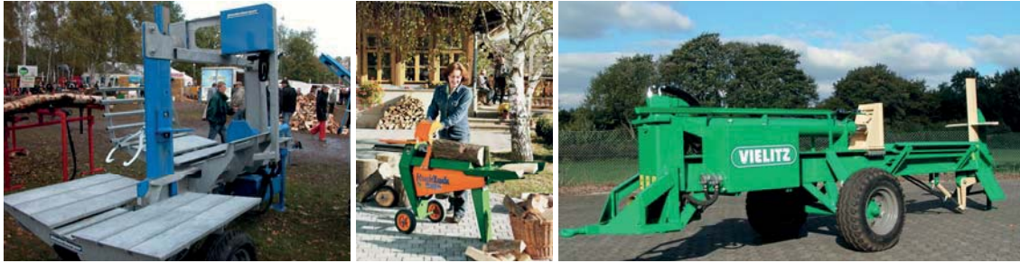
Abbildung 4: Beispiele für Horizontalspalter

Bei Horizontalspaltern wird meist nicht der Spaltkeil durch das Holz, sondern der Holzstamm mittels eines Druckstempels bzw. einer Druckplatte durch den fest montierten Spaltkeil getrieben. Insbesondere wenn längere Stammstücke gespalten werden sollen, können solche Spalter durch die Verwendung von Auflagetischen (siehe Bild links) einfacher beschickt werden, als wenn die Stämme zunächst aufgerichtet werden müssen. Dies setzt dann allerdings voraus, dass die Stämme nicht zunächst manuell auf den Auflagetisch gehoben werden müssen, sondern z. B. durch einen Kran aufgelegt werden können. Die Antriebsmöglichkeiten sind letztlich vergleichbar mit denen der Vertikalspalter. Auch bei Horizontalspaltern werden kleinere Maschinen meist händisch zum Einsatzort gebracht, an die Dreipunktaufhängung eines Schleppers montiert oder auf einen Anhänger aufgebaut. Einen Überblick über die derzeit am Markt verfügbaren Horizontal- und Vertikalspalter liefert KWF (2008).