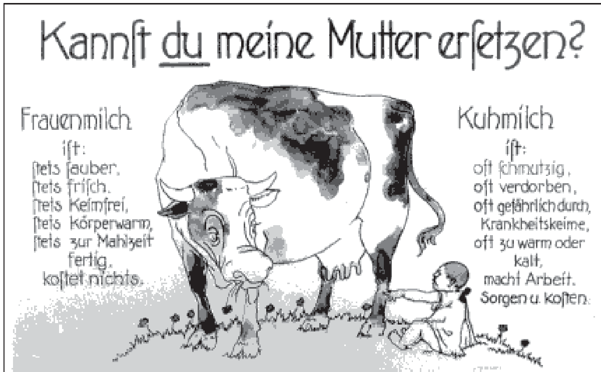
Abb. 1: Stillpropaganda

Als weiterer Anreiz wurden 1905, erstmals in Berlin, Stillprämien in Form von Geld, Kleidern oder sonstigen Vergünstigungen eingeführt. Später erhielten stillende Mütter per Gesetz nach Vorlage eines ärztlichen Zeugnisses 75 Pfennige Stillgeld. Trotz großem Erfolg dieser Maßnahme, wurde im Jahr 1968 das Stillgeld in der Bundesrepublik abgeschafft, ohne dass hierzu die Kinderärzte befragt worden wären. 25 Um auch die optimale Versorgung von Säuglingen zu gewährleisten, die nicht von ihren eigenen Müttern gestillt werden konnten, wurden von amtlichen und privaten Stellen Muttermilchsammelstellen eingerichtet, an denen stillende gesunde Mütter gegen eine Aufwandsentschädigung ihre Überschussmilch abgeben konnten. Diese wurde an frauenmilchbedürftige Säuglinge weitergegeben. Weitere Bestrebungen galten der Verbesserung der Milchhygiene, um eine frische, nicht verunreinigte Milch für Säuglinge zu erhalten und somit die Mortalität der künstlich genährten Kinder herabzumindern. 26 Zur Unterstützung der Mütter entwickelten sich 1905 die ersten Pläne zur Entstehung der Mütterberatung, welche sich vor allem unter den Auspizien der im selben Jahr ge-